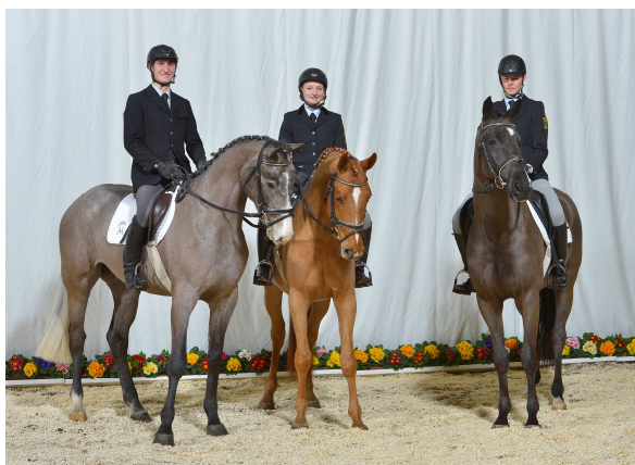
Im Angebot der Gestütsauktion am 8.März 2014: Che Orfano, Intellekt und Sir Eitz

Weitere Väter der Auktionspferde sind unter anderem LVALETTO , der zahlreiche erfolgreiche Nachkommen im S-Spring- und Dressursport hat, LOVING DANCER , ebenfalls Vererber mit Doppelveranlagung, SIR NYMPHENBURG I , der gleich aus