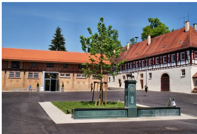
Der Gestütshof des Haupt- und Landgestüts Marbach ist einen Besuch wert

Der Aufenthalt bei uns hat Ihnen so sehr gefallen, dass Sie ein Andenken mit nach Hause nehmen möchten? - Kein Problem! Unser Gestütsshop ist in den Ferien täglich von 10.00 bis 17.00 Uhr für Sie geöffnet. Sie finden dort viele tolle Geschenkideen aus dem Marbacher Sortiment.